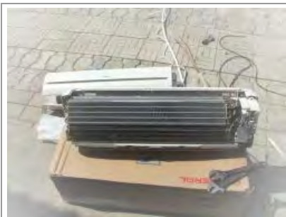
Монтаж General-Fujitsu(Фуджитсу), особенности.

Монтаж сплит-системы General-Fujitsu начинается с полной разборки внутреннего блока сплит системы.