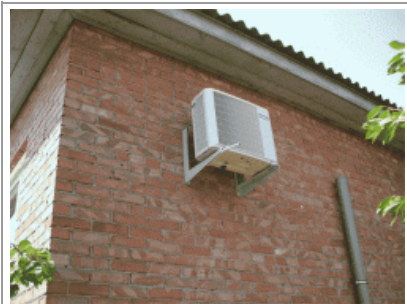
General-Fujitsu на глухой стене.

Вернёмся к нашему монтажу General-Fujitsu. Как видно на картинке, ещё один «подводный камень» при установке, при вакуумировании системы кондиционера Fujitsu(Фуджитсу),