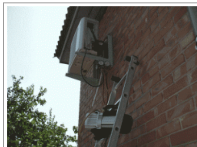
Вакуумация внутреннего блока сплит системы.

В сёлах, на дачах, а также в старом фонде как правило пониженное напряжение из-за «просадки» электро-сетей, а кондиционер (заводская заправка) заправлен приблизительно до 7-ми метров межблочной трассы, поэтому иногда при пониженном напряжении в сети приходится приспускать газ-фреон, что бы исключить перегрузку компрессора кондиционера по току.