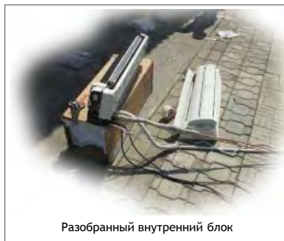
Разобранный внутренний блок

Это и подготовка межблочной трассы для тылового монтажа кондиционера, как можно заметить, то длина межблочных соединений сплит системы отнюдь не 30-40 см., как думают многие, а длина составляет порядка 1,2-1,5 метра.