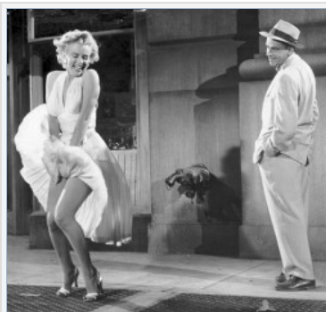
Ветер, как приятно наблюдать, охлаждение и кондиционирование, три в одном.

Симптом: Нет неисправности таймера: с открытым место установки единицы наблюдается в районе, где наружный блок устанавливается с 380V трансформатором, кабельное телевидение и телефон окно перехода, эти специальные высокочастотные рассеяния электромагнитных волн вместе, представляют собой мощный источник помехового сигнала, что делает процессор все еще не может правильно передавать сигналы, рабочее состояние машины будет работать в ненормальном состоянии.