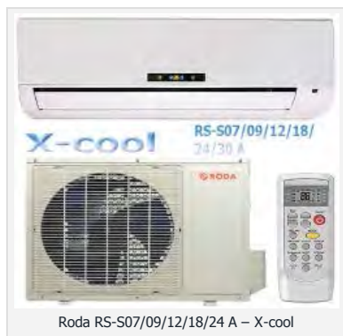
Roda RS-S07/09/12/18/24 A – X-cool