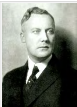
Аксель Веннер-Грен, — шведский совестливый мультимиллиардер

История бренда Electrolux ... Эх если-б мы знали, что основатель компании Аксель Веннер – Грен , — так любивший антропологию и евгенику, этот рыцарь тамплиеров, с увлечением циркулем, вместе с Гитлером мерял черепа неполноценных, по их мнению, евреев, то, мы совсем-бы по-другому относились к этому замечательному и популярному бренду бытовой техники Electrolux.