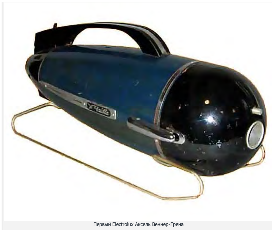
Первый Electrolux Аксель Веннер-Грена

Что там Аксель, наши, русские рыцари и бело-ленточные правозащитные богатыри от Kirby, чуйкой и рылом занюхав деньгу, с подъёмом минимум в 5 раз впихивали по-методу Веннер-Грена свои гремящие пылесосы, приговаривая, что Вам повезло.