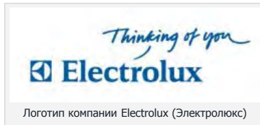
Логотип компании Electrolux (Электролюкс)