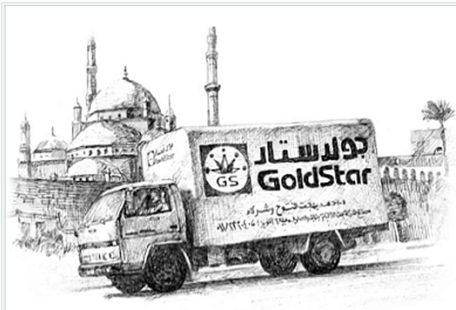
Глобализация как предвестник возрождения goldstar.

производственные затраты и затраты связанные с логистикой – на лицо. Компания LG за свою не долгую с самостоятельную деятельность как интернационального самостоятельного глобального игрока.