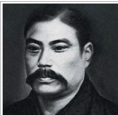
Ятаро Ивасаки, сын Ямонаучи, — основатель компании Мицубиси.

Ятаро Ивасаки, основатель фирмы и бренда Мицубиси. Есть мнение, я его разделяю частично, что