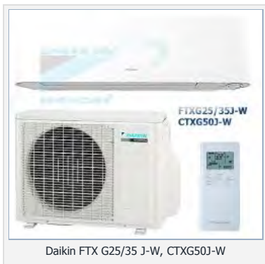
Daikin FTX G25/35 J-W, CTXG50J-W