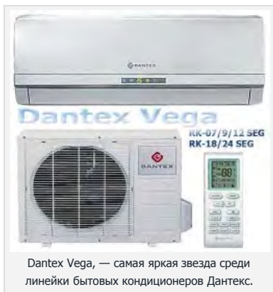
Dantex Vega, — самая яркая звезда среди линейки бытовых кондиционеров Дантекс.