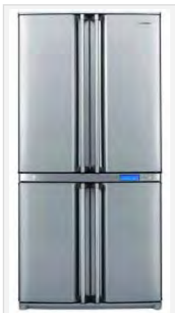
Sharp SJ-F96SPSL победитель.

Холодильник выбирая, Я, как раньше, представляя, Вот он, с радостью купил, Но, нет его, я загрузил.