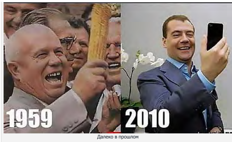
Далеко в прошлом

Долго часав "репу", перевернул практически весь интернет... Вывод не утешительный, как всё запущено в этой отрасли, — холодильная техника. Даже если позволяют средства и есть желание купить, но нет выбора. Не паханное поле. Один колосок я заметил, им этим колоссом оказался холодильник фирмы Шарп.