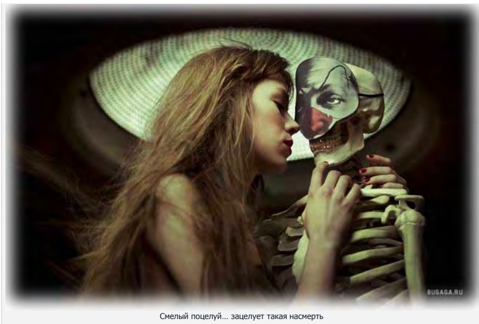
Смелый поцелуй... зацелует такая насмерть

Например рассмотрим ближайших конкурентов – холодильник бош и отзывы о нём. Во первых: магнитная пластина на двери настолько мощная, что открывая двери холодильника двигается и сам холодильник, если он расположен на скользком, кафельном полу.